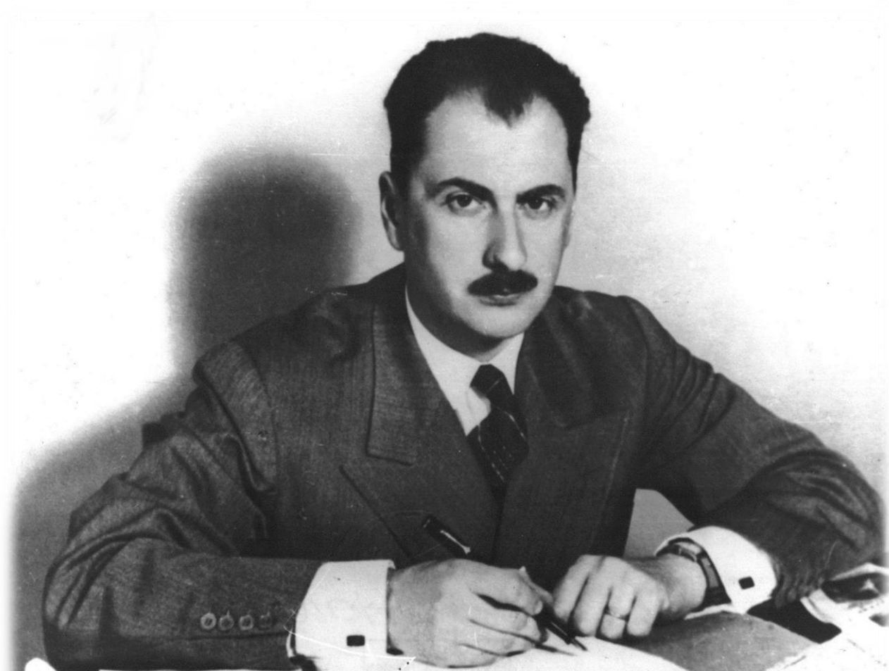
Fotografia 1: Gheorghe I. Brătianu, fotografia de academician a marelui istoric