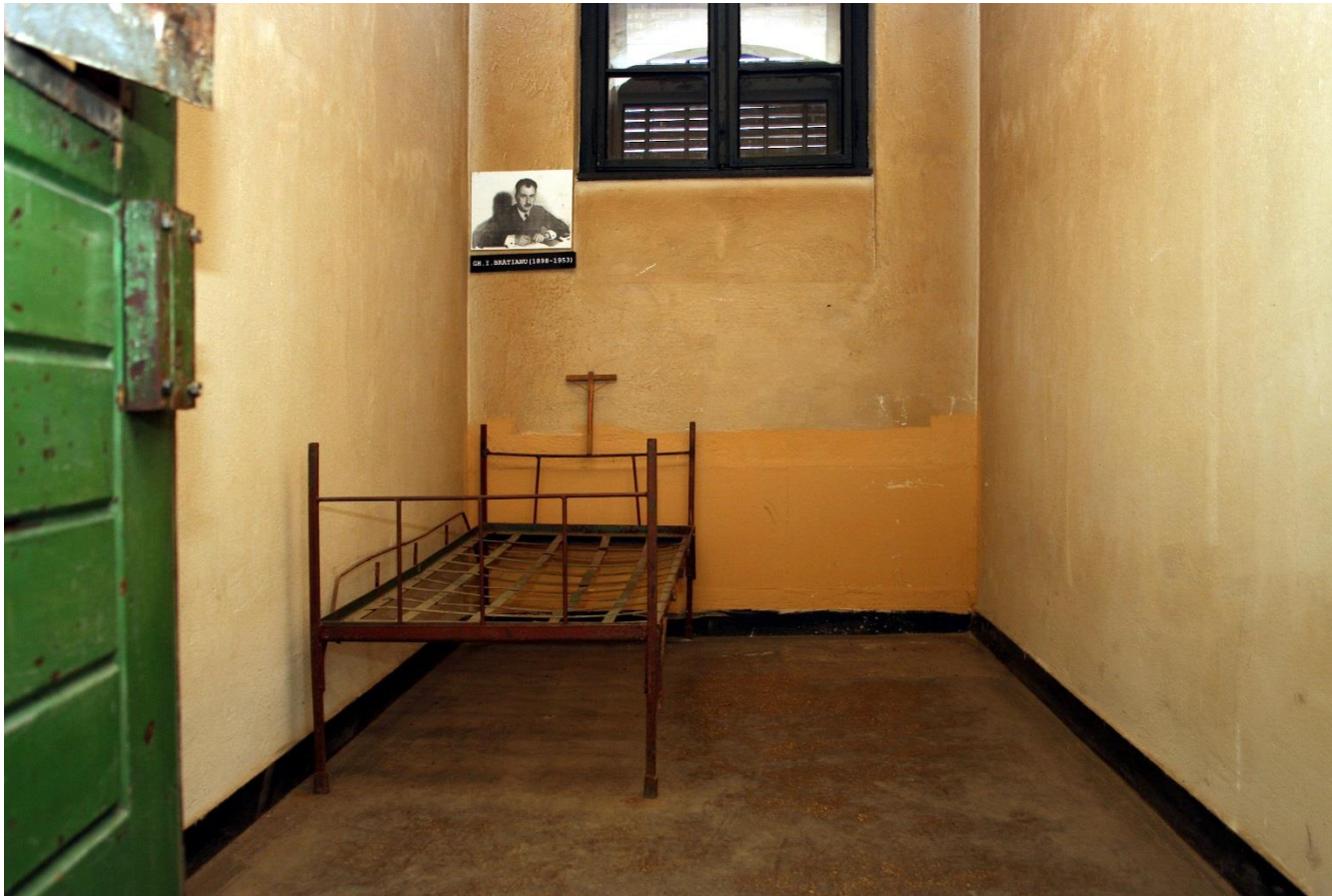
Fotografia 6: Celula în care a murit Gheorghe I. Brătianu la închisoarea de la Sighet