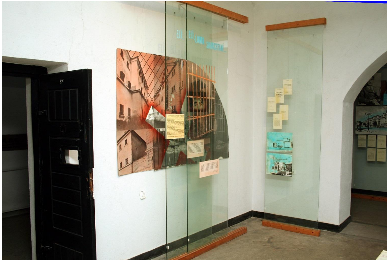
Fotografia 9: Detaliu din sălile „Gheorghe I. Brătianu