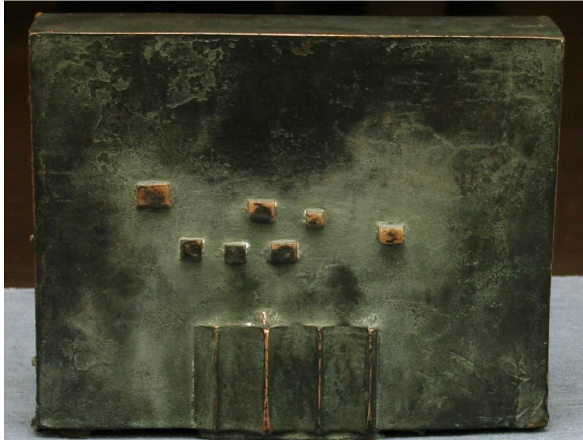
Fotografia 11: Bronz de Ovidiu Maitec purtând, în semn de omagiu, titlul cărții lui Gh. I. Brătianu „Marea Neagră”