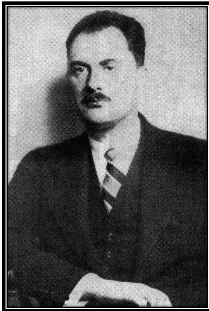
Fotografia 12: Gheorghe I. Brătianu